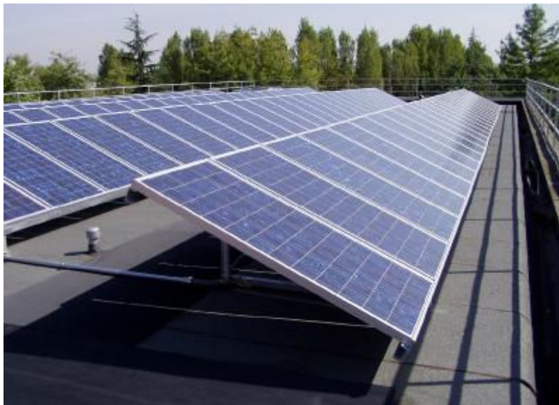
descrizione immagine 2