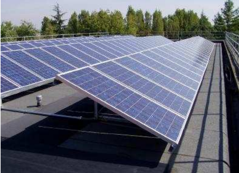
descrizione immagine 2